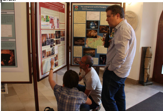
Magyar poszter bemutatása az érdeklődőknek

A terepi utazások során bejártuk többek között a környék forrásait, az ikonikus Skocjan-barlangot, az egykori felső fosszil alig-alig észlelhető romjaival együtt, és természetesen a Postojnai-barlangot is. Mint minden évben, az utolsó napi túra a Ljubljanica-folyó vízgyűjtő területét, a forrásokat, nyelőket, poljékat és a Rakov Skocjant járta körbe.