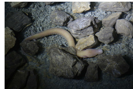
Proteus anguinus a Planina-barlangban

A konferencia nyelve angol, a részvételi díj 175 euró (diákoknak csak 75 euró). Ez magában foglalja a fogadásokat és a kirándulásokat is.